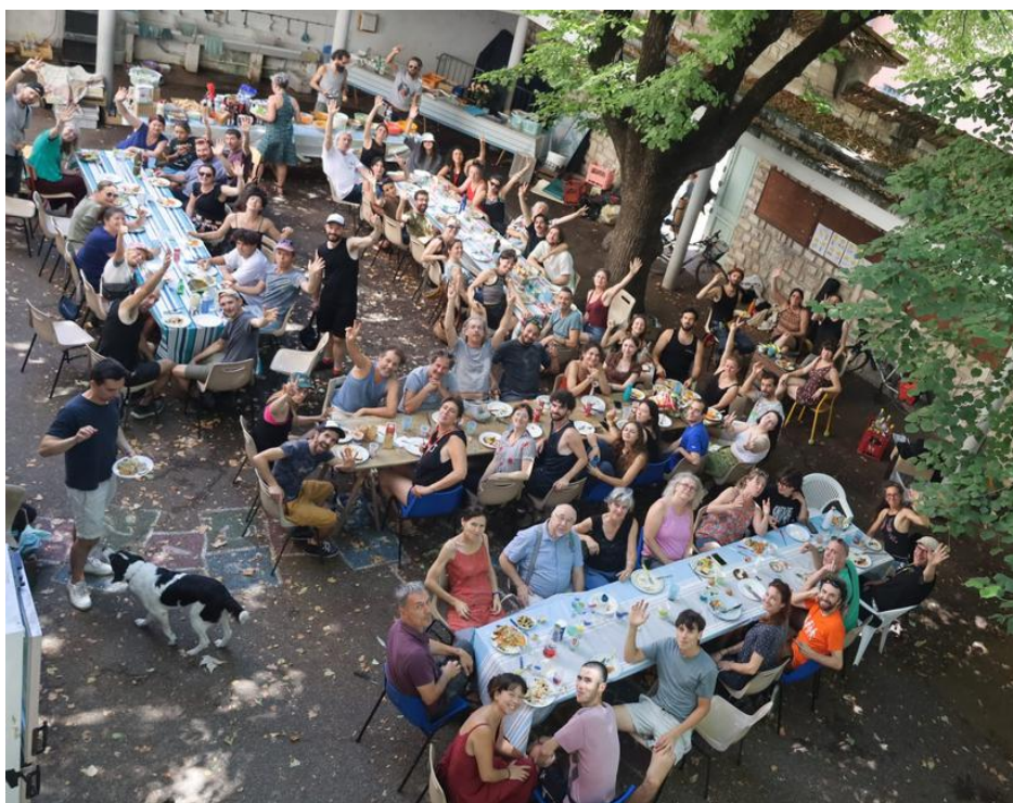
Repas de clôture - jour du démontage- juillet 2024

Les compagnies s'engagent à ne pas être "consommatrices" du lieu mais à participer à son développement, sa visibilité, sa notoriété.