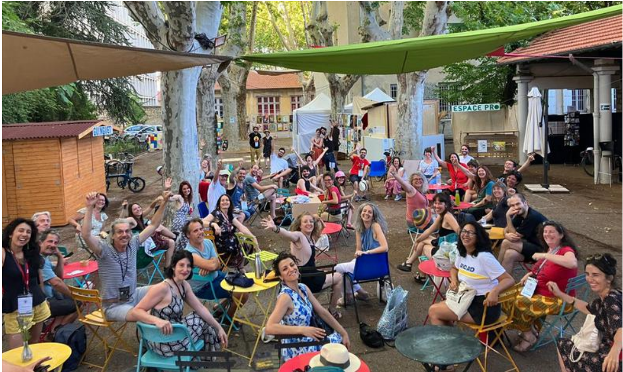
Réunion du collectif suite à la générale - juillet 2024