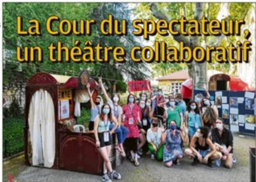
Quinze compagnies, seize spectacles, des ateliers à la fois : la Cour du spectateur s'attend que vous.

Dans la même idée, le site entier est confié à la gestion de tous, à l'aide d'un planning participatif. Prix de 80 personnes, artistes, salariés ou bénévoles de la Ligue, bouillonnent donc ici afin de proposer des animations ludiques, des rencontres et autres animations pour